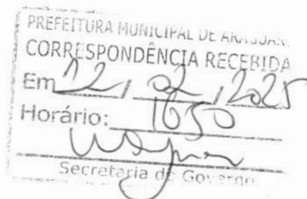
RAFAEL SCALIA GUEDES Secretário Municipal de Serviços Urbanos e Distritais